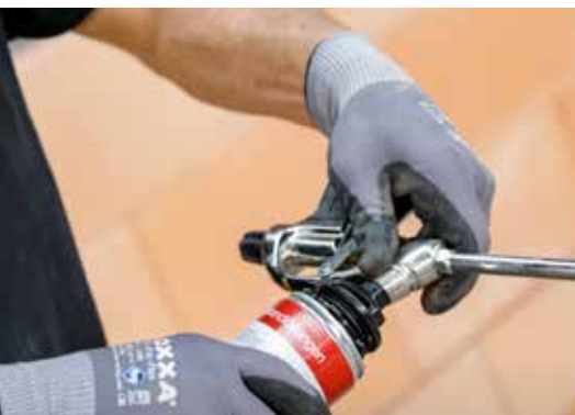
3. Vissez la bombe Dryfix extra sur la tête de projection nettoyée