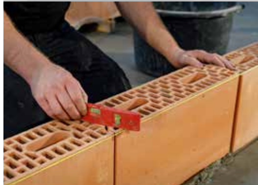
6. Contrôlez la planéité de l'assemblage à tenons et mortaises