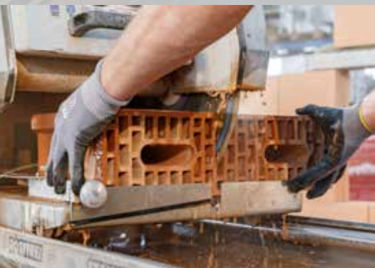
18. Découpez les blocs au moyen d'une scie à table

* Avec des murs d'un largeur de 10 cm, appliquer 1 cordon au milieu du bloc