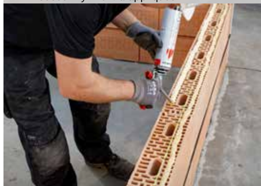
16. Appliquez Dryfix extra en 2 cordons de 3 cm de largeur, à \pm 1 cm des côtés extérieurs du bloc