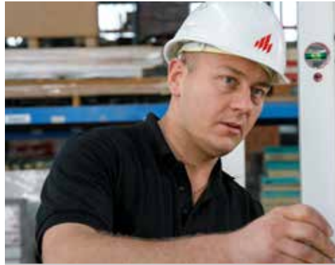
1. Installez les profilés