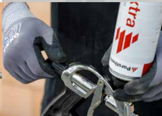
4. Réglez le débit au moyen de la vis