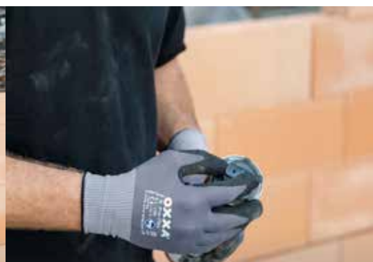
2. Retirez le clip de protection