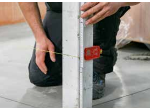
3. Placez le cordeau de maçon pour la première couche de blocs