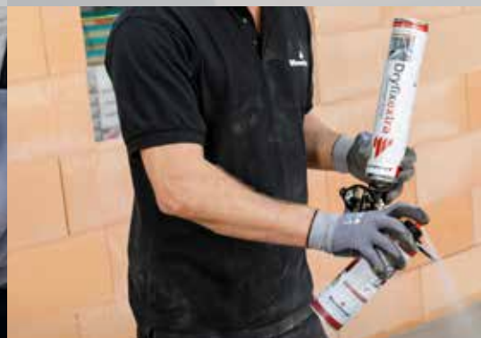
5. En cas de courtes pauses, nettoyez la tête de projection avec Dryfix cleaner