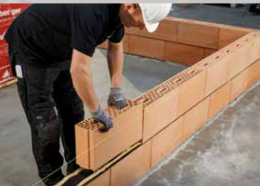
13. Posez la seconde couche de blocs