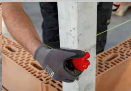
15. Appliquez le cordeau de maçon à une hauteur de \pm 2 cm sous la hauteur de la couche suivante