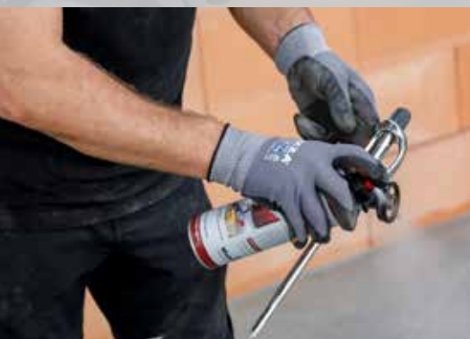
6. En cas de pauses plus longues, retirez la bombe Dryfix extra et nettoyez la tête de projection avec Dryfix cleaner