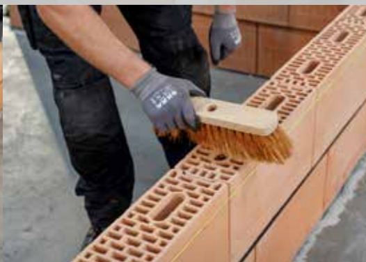
14. Brossez les blocs